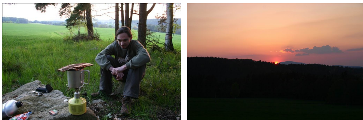
Několik momentek z našeho lesního bydliště.