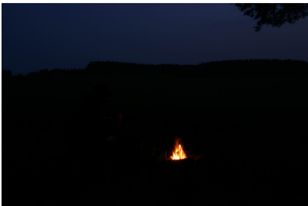
Já skolen dnešním parným Sluncem a hledáním (nahore vlevo); západ Slunce nad Kletí (vpravo nahore); skromný ohýnek pro zahřátí (vlevo).