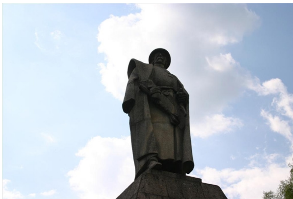
Náš husitský hrdina, vojevůdce Jan Žižka z Trocnova.

Ve čtvrtek 8. května 2008 jsme za parného dne vyrazili po pravém polední z přelidněných Pardubic přímo na jih. Cesta byla svižná, i když to sluníčko mohlo trochu ubrat na síle. Už před čtvrtou odpoledne jsme se pak octli nedaleko Ledenic, kde jsme se jednoznačně rozhodli navštívit našeho českého patrona, alespoň z dob husitských, Jana Žižky z Trocnova. Přesněji řečeno jeho pomník. A že to byl pořádný pomník. Kousek od Trocnova stojí uprostřed veliké louky ohraněné hlubšími lesy vysoká „pyramida“, na níž náš patron hrdě stojí. Hledí do dále. Snad jej dnešní mládež někdy v budoucnu neponičí.