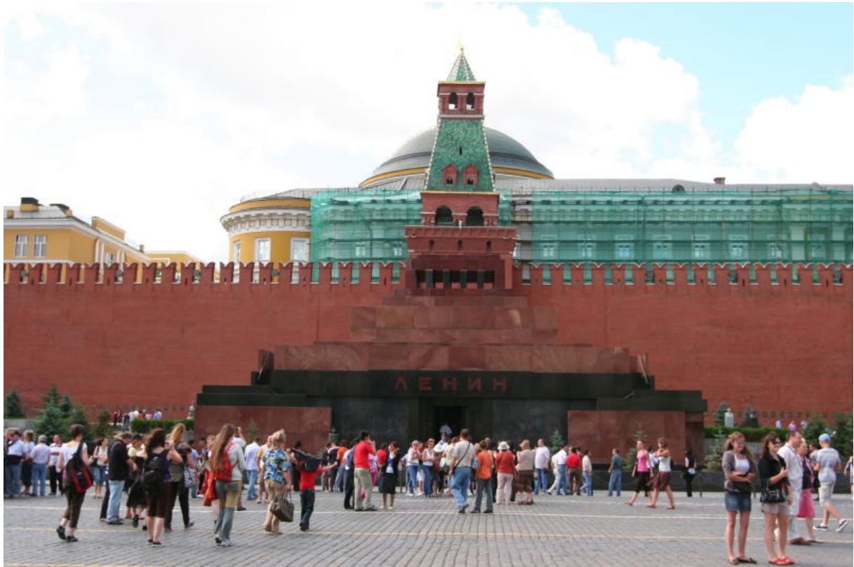
Leninova hrobka a Kreml v pozadí. Prostě typické Rudé náměstí.