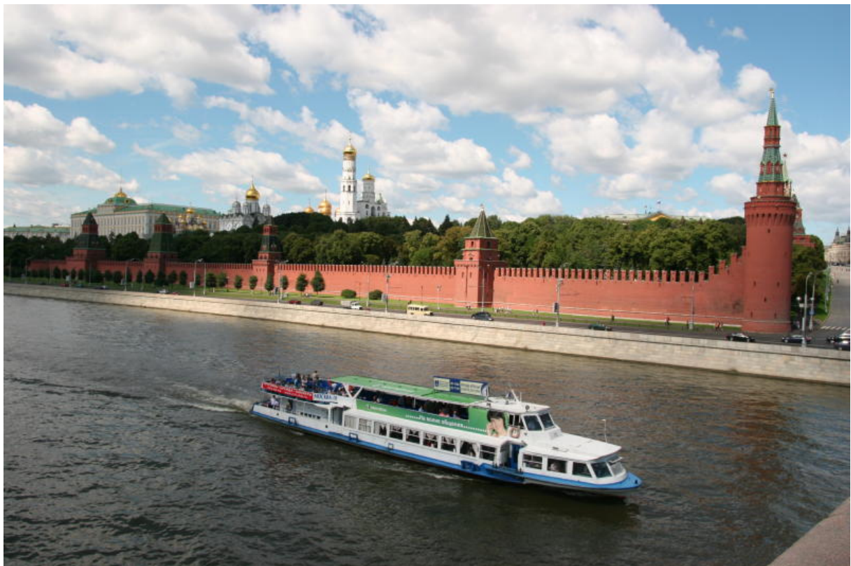
Rušná Moskva (řeka) v rušné Moskvě (město). Kreml v pozadí.