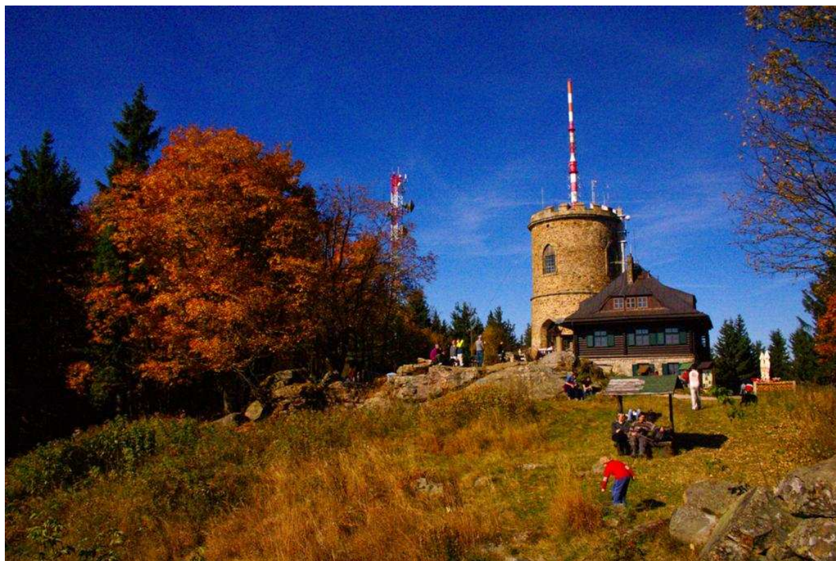
Josefova rozhledna a barevný podzim. Prostě nádhera.

nejkrásnější nás čekalo až na samotném vrcholu. K mému údivu ani tak teplota značně neklesla oproti teplotě tam dole a navíc nefoukal vítr. Bohužel kleťská observatoř měla zavřeno a Josefova rozhledna byla v rekonstrukci. Takže jsme se tak poflakovali mezi kameny, z Petra postupně skapal pot, jehož objem by patrně stačil k nakrmení dětí třetího světa (vláčel k vrcholu krosnu s technikou a oblečením), zkoušeli hledat Venuši na denní obloze (kvůli lokálním cirrům bezúspěšně) a hleděli ve skulinkách mezi stromy do vzdálených šumavských vrcholů, nad nimiž se tyčily rakouské Alpy. Byly nevýrazné, ale byly tam. Ani vrchol ale politický marasť neminul, námi ke Klínovci „odsouzení“ Zelení se vyskytovali zase tady. Největší obdiv tak proto patřil dvěma číšníkům, kteří v jednom kuse bez přestání čepovali a podávali mohutné řízky, či porce guláše, v místní restauraci. S Petrem jsme si poctivě vystáli frontu právě na ty řízky. A musím říct, že po tom výsostném výstupu a lezení po vrcholových skaliskách (kde jsem nedobrovolně málem zachraňoval dvě malé budoucí horolezkyně), to bylo úžasné nasycení. Spolu s malým neporušeným tektitem v ruce (nalezeným během včerejší výpravy) jsem jen holdoval krásně prožitému i zakončenému víkend.