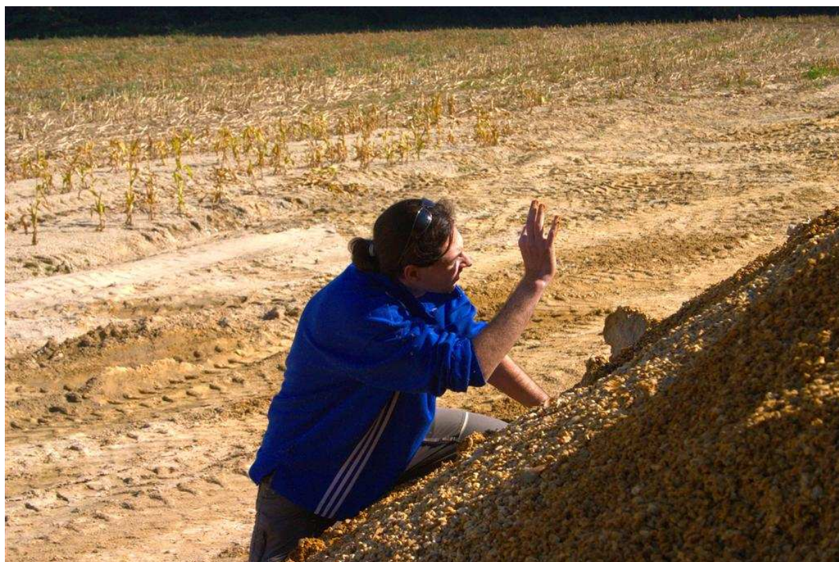
Já a přebytečná kupa ločenické pískovny. Počasí je krásné, ale moc nám to nepomáhá.

Po jejich odchodu se vydávám k tomu místu a nestačím se divit. Jejich evidentně čerstvou prací je jáma přes 5 metrů hluboká a 3 metry široká. A to zdaleka není tak