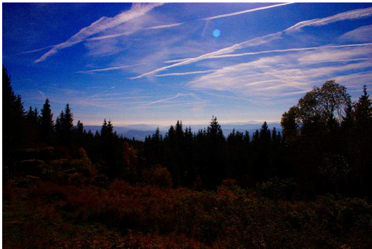
Úžasná scenérie vzdálených hor při pohledu z vrcholu Kletě. Dokonalou dynamiku do obrazu dodává podzimní kolorit a čistě blankytná obloha.

A tenhle moment pro mě opět znamenal asi nejlepší část výpravy. Výstup byl po mnohých stránkách velmi neobvyklý. Ve žni blízcích se krajských voleb byla místní atrakcí volná vstupenka na lanovku pod taktovkou KDU-ČSL. Osobně nemám žádnou chuť v astronomickém článku vyjadřovat svůj politický postoj, nicméně asi vás nepřekvapí, že jsme s Petrem okamžitě začali dumat, které pak to vrcholy si asi „vzaly“ jiné politické strany. ODS Sněžku, ČSSD Říp, Zelení něco zarostlého ... Klínovec? Naše úvahy se však netěšili příliš velkému ohlasu, neboť (logicky) pod vrcholem byla většina lidí zástupcem právě zmíněné politické strany. Kdyby dali spíš zadarmo klobásku a nenutili lidi k lenosti z volné lanovky, určitě bychom smýšleli jinak. Tak jsme dojedli chutnou zaplacenou klobásku a vydali se (taky zadarmo) po svých s cílem zdravé chůze k vrcholu.