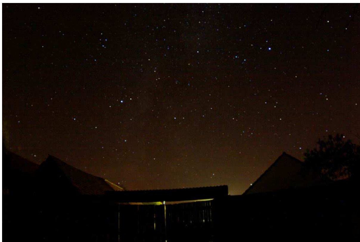
Krásné hvězdné nebe nad osadou pana Vaclíka. Vlevo nahoře září Vega, vpravo uprostřed Altair, vysoko nad ním souhvězdí Delfína a je patrný i náznak mračen Mléčné dráhy.

Aby toho málo nebylo, čistý vzduch a jihočeská podhorská oblast nám předvedly Mléčnou dráhu v plné kráse. Podmínky byly natolik úchvatné, že když jsem pak nesl v náručí do chalupy dříví, musel jsem se zastavit jak poutník bez lucerny a koukat minuty do nebe. U galaxie M31 v Andromedě nebyl pochyb, že jde o galaxii, ale namátkou se dala periferním viděním spatřit i M33 v Trojúhelníku. A to už hvězdáři uznají, že není jen tak.