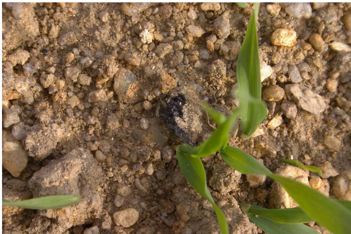
Konečně vltavín! Takže přeci jen rostou.