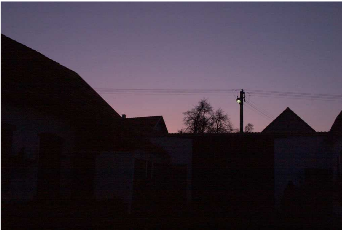
Purpurový soumrak ze statku pana Vaclíka.

V sobotu 25. října se nám s vltavíny moc nezadařilo. Únavná cesta nás donutila spát až téměř do jedenácté, posléze jsme se vydali na osvědčenou lokalitu Ločenice-Nesměň-Chlum, ale výsledkem půldenního pátrání byl jen malý střípek nedaleko pískovny, který mi v ruku spočinul krátce před západem Slunce. Den byl ale svěží a slunečný a k radosti nás obou k nám přišel na pole na návštěvu přítulný vlčák (tedy spíš ona), který patrně měl vypadat a štěkat hrozivě (neboť přiběhl právě z té pískovny), ale moc se mu nechtělo. Takže den sice bez většího úlovku, ale s mazlivým psem hlídačem, na kterého zdaleka nebylo zapotřebí použít voňavé klobásy.